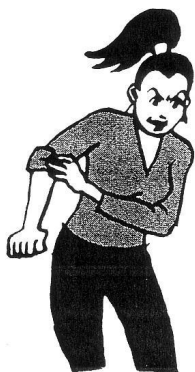
2. Elle est .....