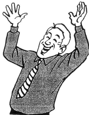
3. Il est .....