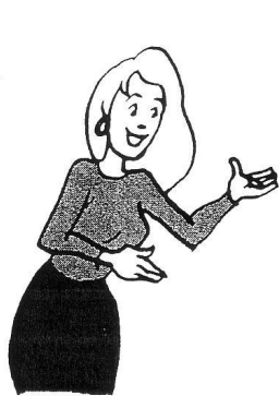
1. Elle est aimable .