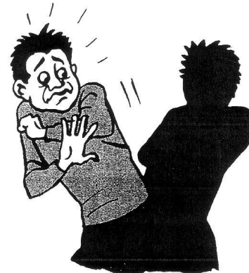
4. Il est .....